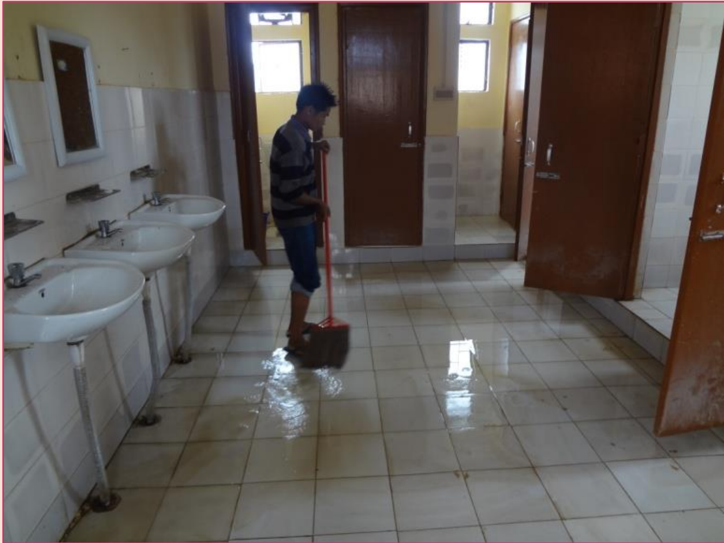
Up keeping & Cleaning of Boys Hostels