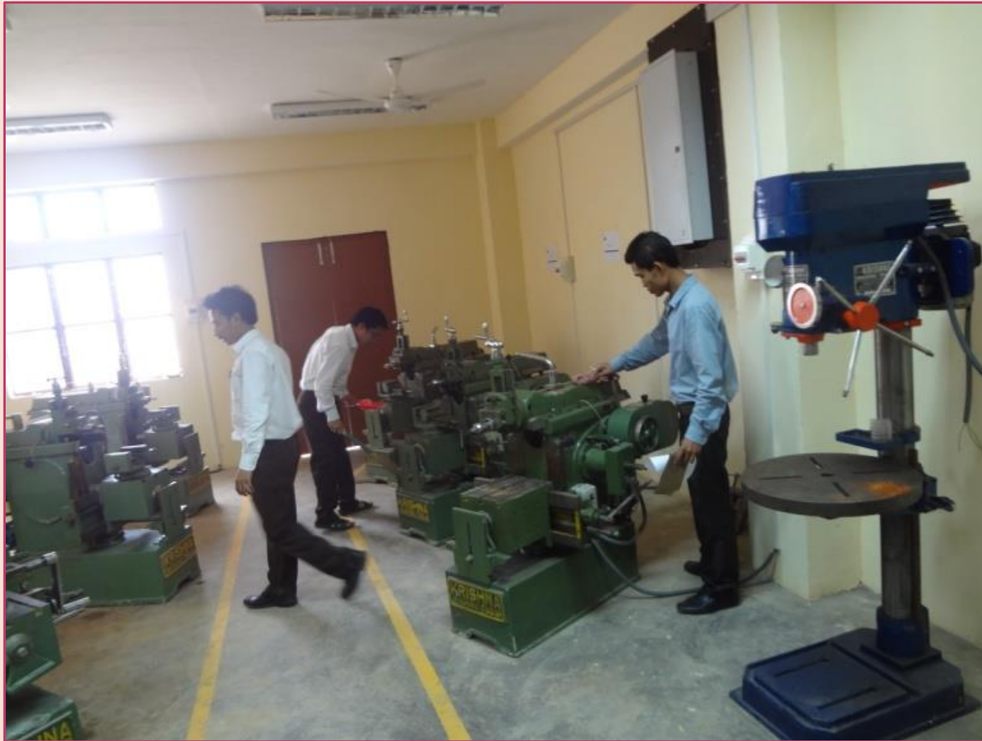
Cleaning of machineries in Tool Room Deptt.