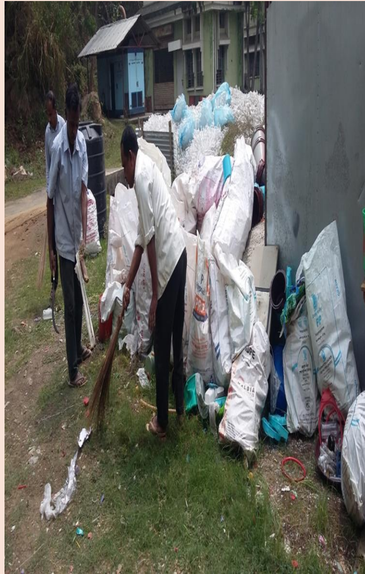
Cleaning of Solid Waste