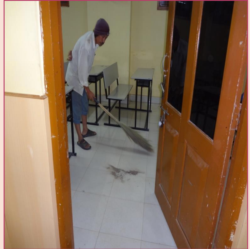
Up keeping & Cleaning of Class Rooms