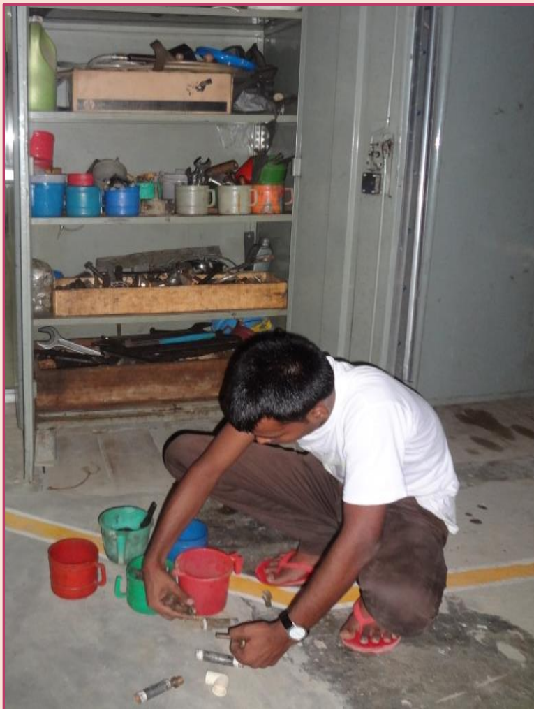
Up keeping & Cleaning of Machineries at Processing Shop-Floor